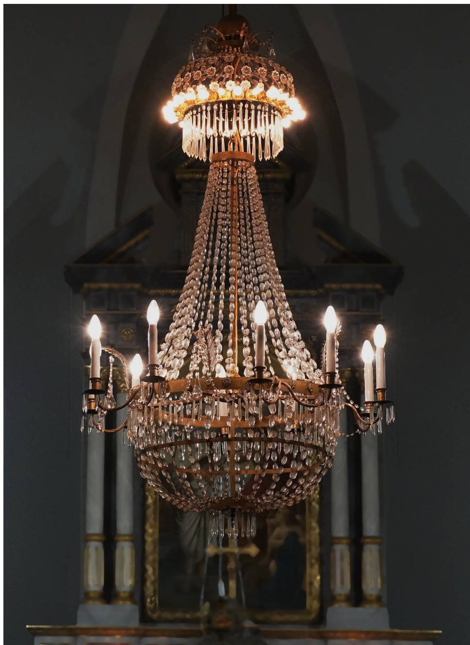
Budiž světlo ...