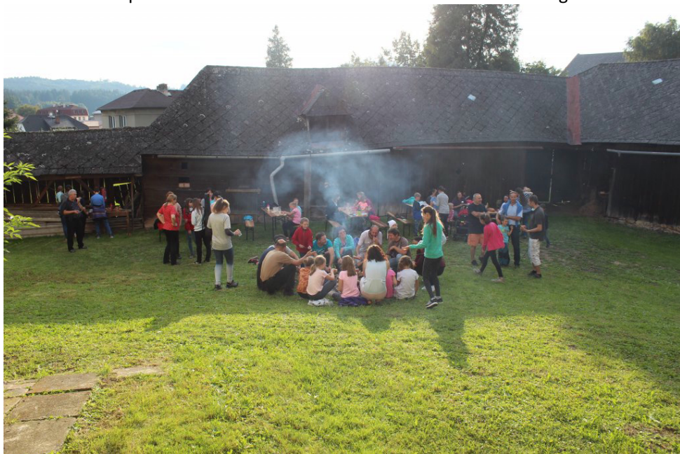
Vzpomínáme na léto 2020: Opékání na faře