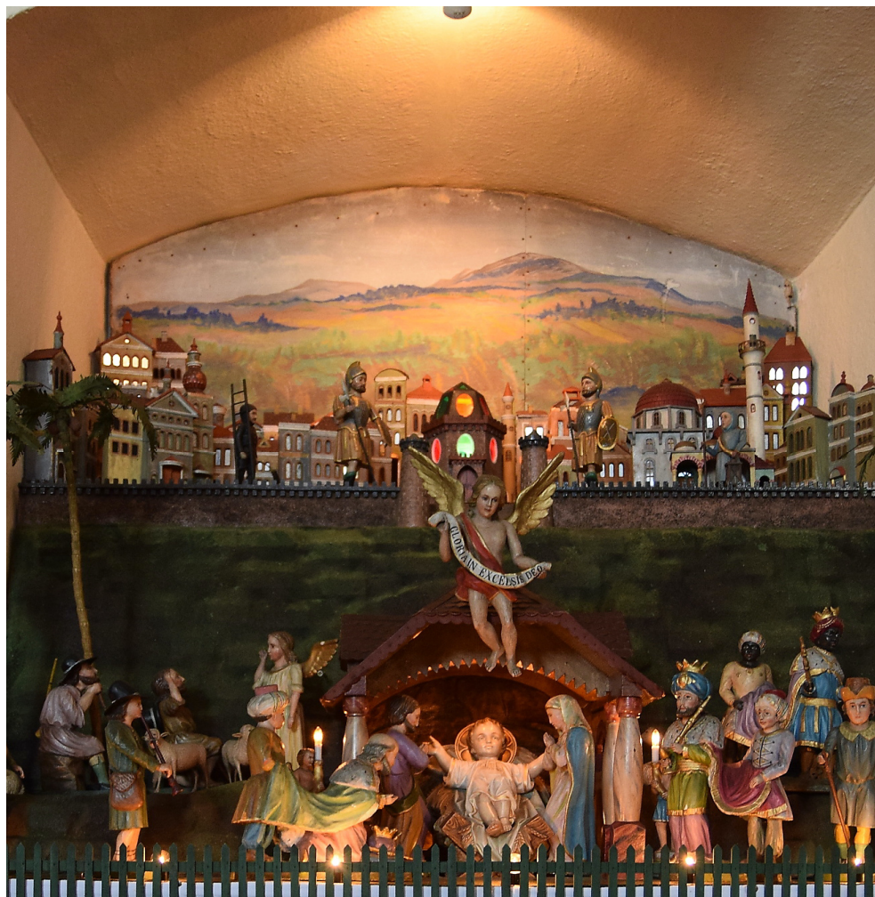
VERAŇŮVCE – SV. JÁN KŘTEL