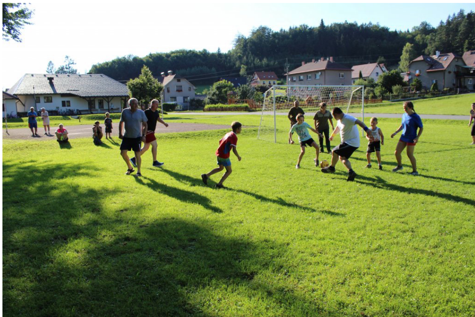
Vzpomínáme na léto 2020: Farní Fotbalová Amatérská Liga